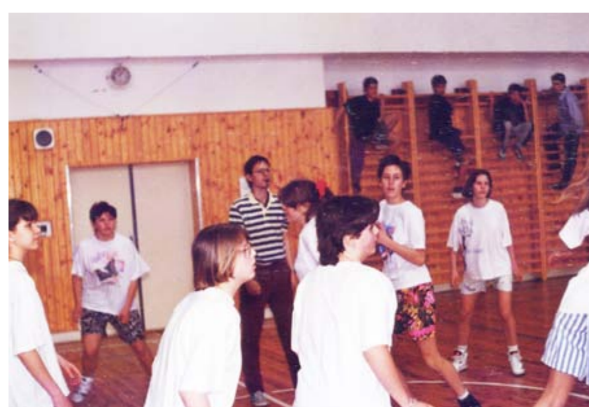
Tělocvična na ZŠ Hlinky