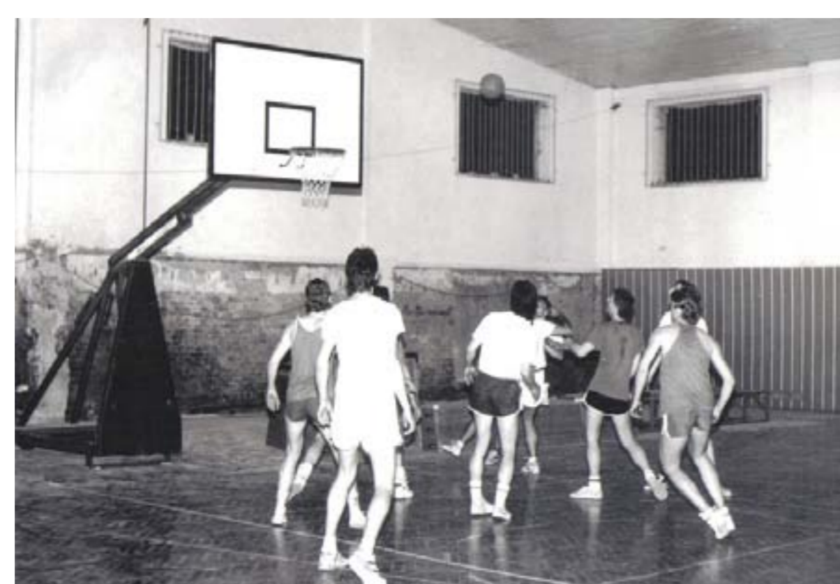
Tělocvična v kasárnách