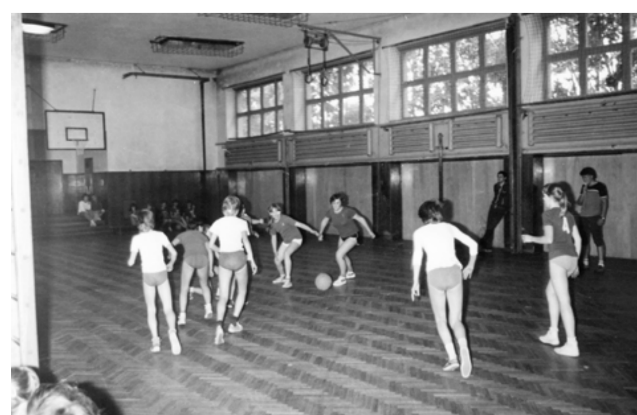
Tělocvična na ZŠ Malá Strana, 80. léta

V současné době je naším snem mít v Týně nad Vltavou regulérní a důstojné venkovní hřiště s umělým povrchem, kterými se již delší dobu můžeme pochlubit nejen větší města, ale i malé obce v našem okolí. Takové hřiště pro nás znamená možnost trénovat i v letních měsících a zároveň zpřístupnit náš sport široké veřejnosti.