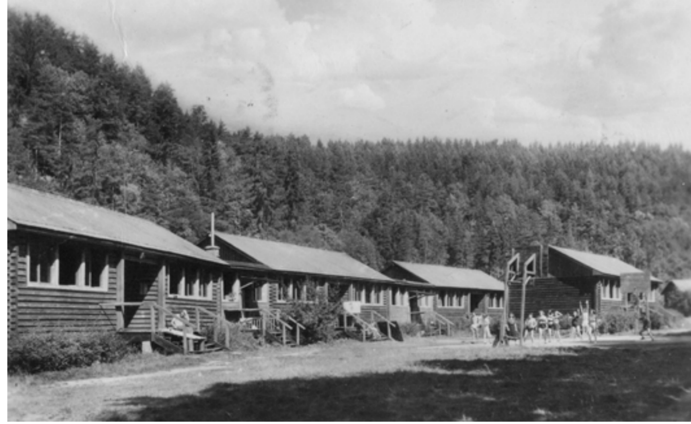
Tábor na Semenci