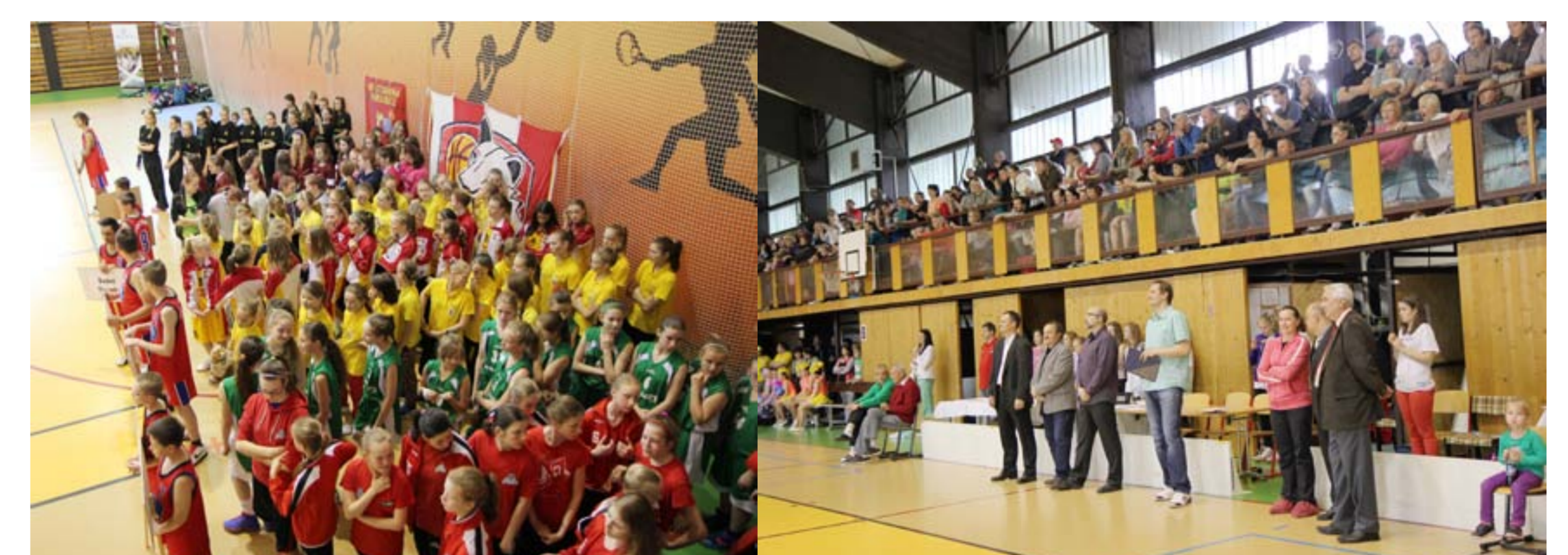
Mistrovství České republiky 2014