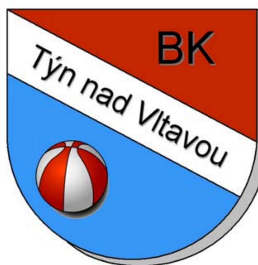
Znak klubu BK Týn nad Vltavou

2006, 2009, 2011, 2014 střídavě odehráli chlapci i dívky v kategorii starších minižáků.