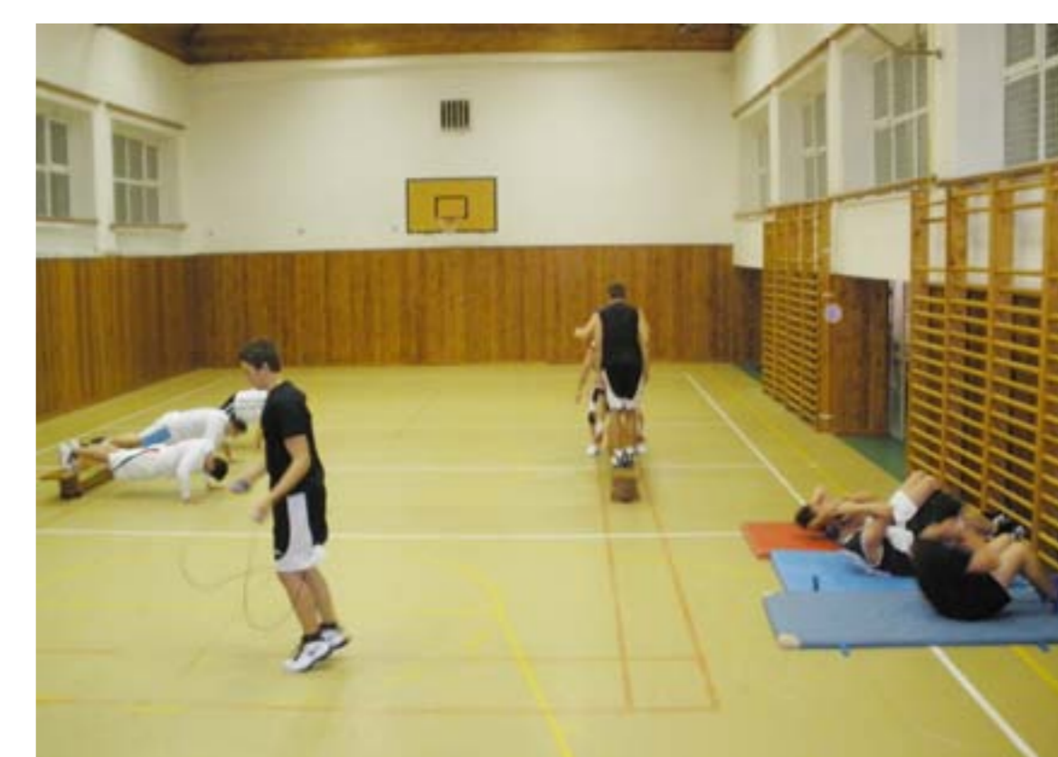
Tělocvična na ZŠ Malá Strana, 2012