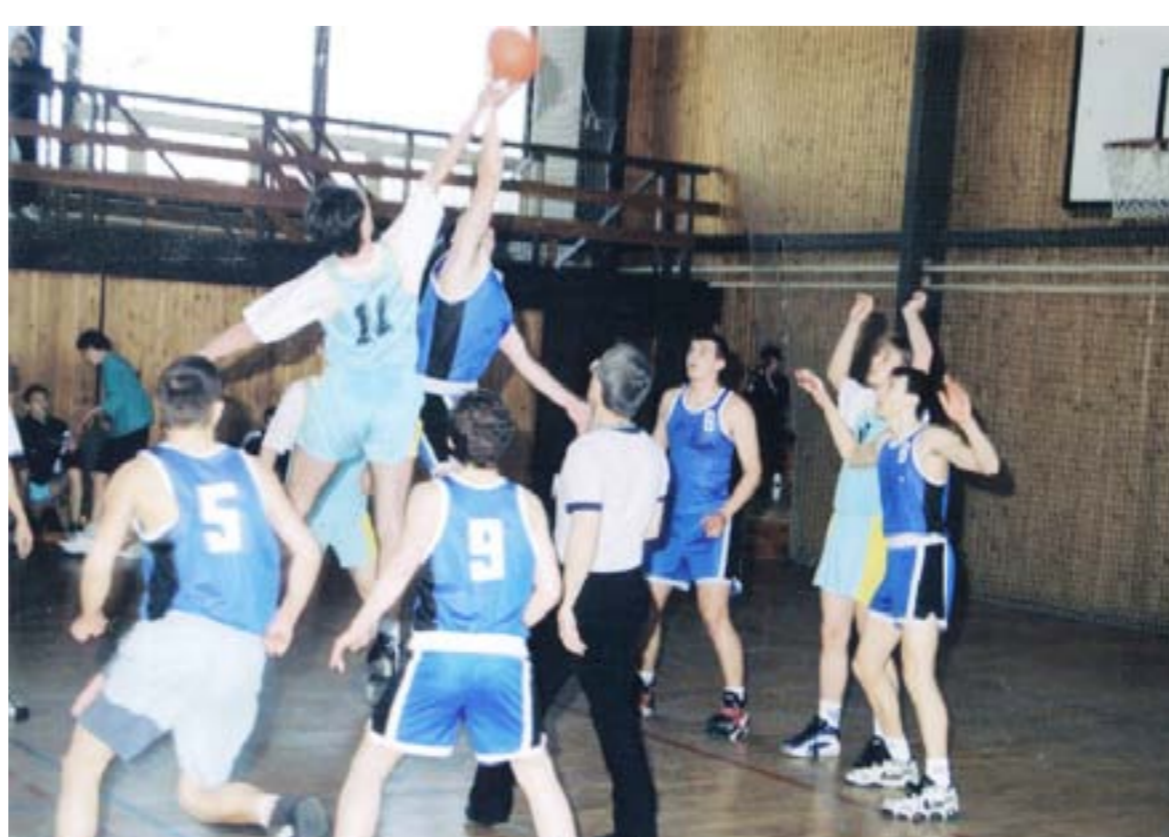
Tělocvična SOU Hněvkovice