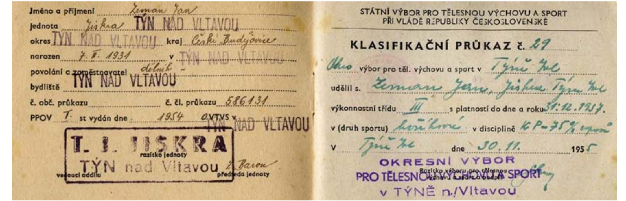
Průkaz hráče košíkové - Jiskra

V dalších letech byl basketbal častěji zařazován do výuky tělesné výchovy na základních a středních školách a uskutečňovala se různá meziškolní klání. V sezoně 1970 – 1971 nastupují v okresním přeboru dorostenecké týmy chlapců a děvčat Gymnázia Týn nad Vltavou.